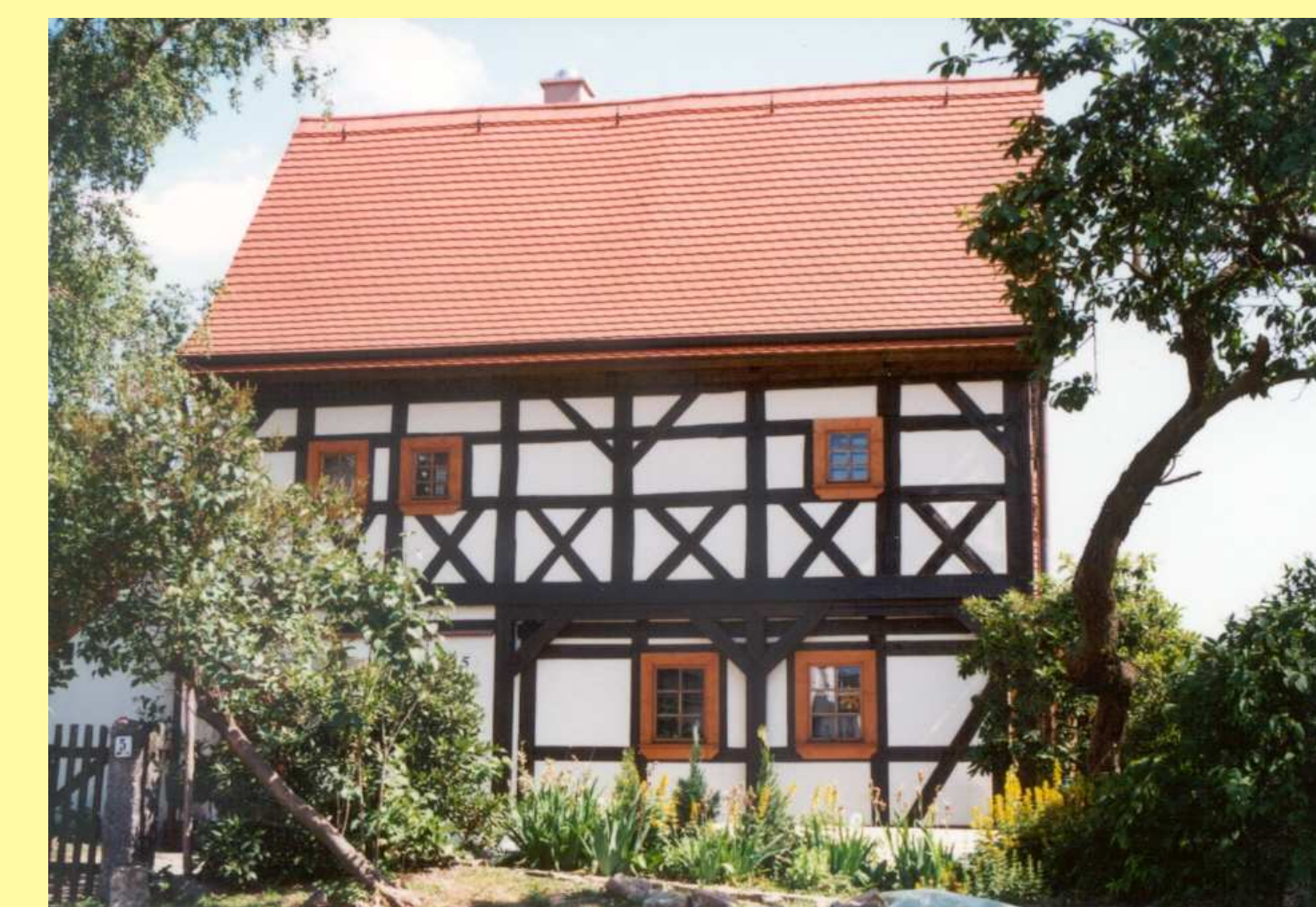
Umgebinderhaus in Dresden - Rockau