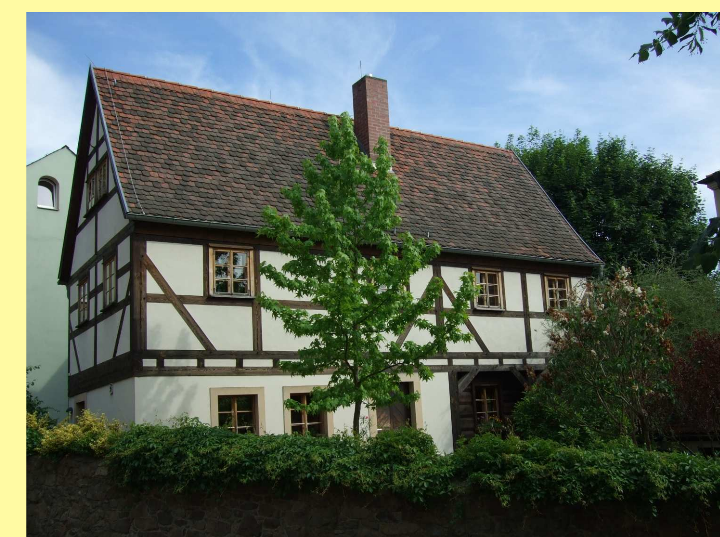
Umgebinderhaus in Dresden - Pillnitz