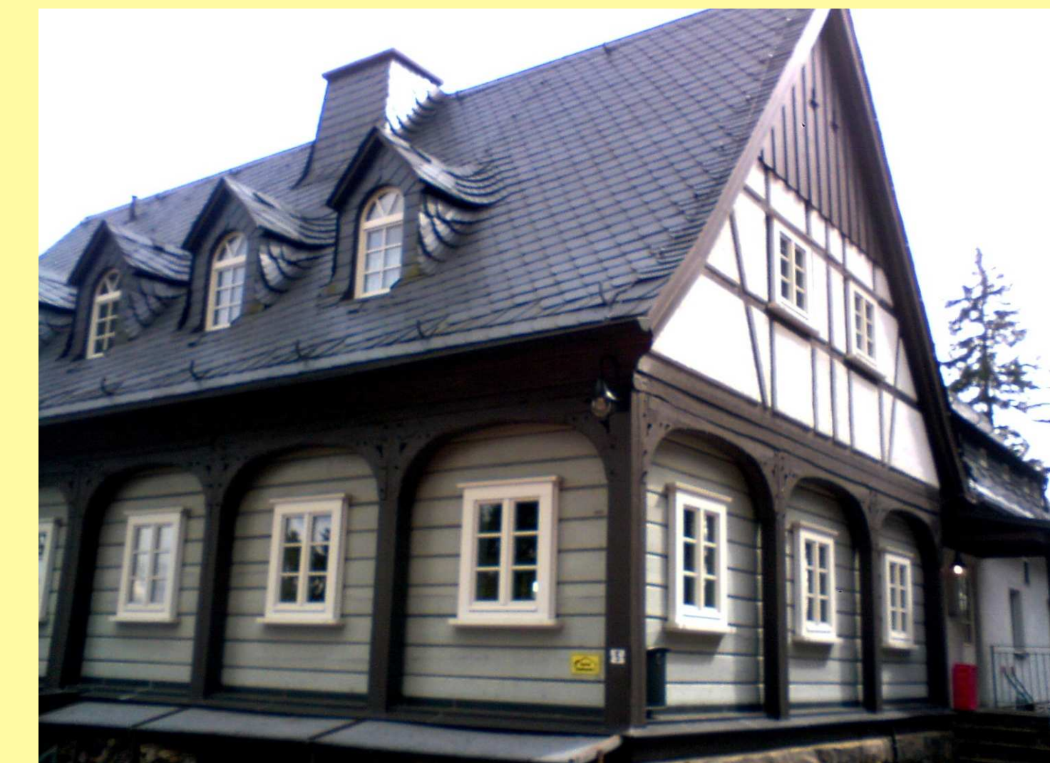
Umgebinderhaus in Altenberg OT Schellerhau